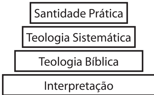
Figura 01. Da interpretação à santidade prática.

Deus falou de modo inspirado, infalível e inerrante aos autores bíblicos. Depois disso, o Espírito Santo continua guiando os cristãos na elaboração de documentos de fé. Quanto mais alicerçados em interpretação sadia e nos princípios de inspiração, infalibilidade, inerrância e suficiência da Bíblia, mais uma confissão ou catecismo é confiável em seu conteúdo. Somente o que é genuinamente bíblico é que produz verdadeira santidade prática (figura 01).